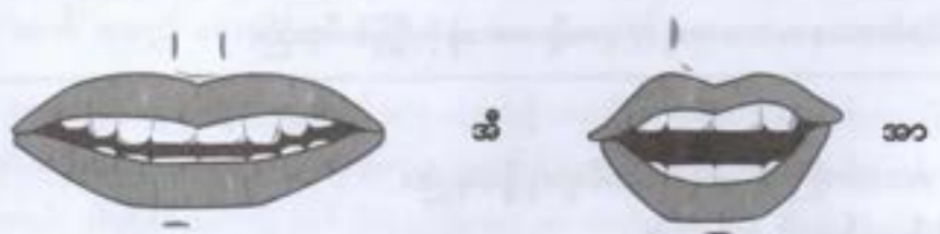
နှုတ်ခမ်းပြန်သရများ

သရဗိုးဗိုးခုနစ်သံကို ရွတ်ဆိုရသော နှုတ်ခမ်းအနေအထားအရ 'နှုတ်ခမ်းပြန်သရ' နှင့် 'နှုတ်ခမ်းပိုင်းသရ'ဟူ၍ ခွဲခြားနိုင်ပါသည်။ 'အိ၊ အေ၊ အယ်၊ အာ'သရများကို ရွတ်ဆိုရာတွင် နှုတ်ခမ်းကိုပြန်ပြီး ရွတ်ဆိုရသည့်အတွက် 'နှုတ်ခမ်းပြန်သရ'များဟု ခေါ်ပါသည်။