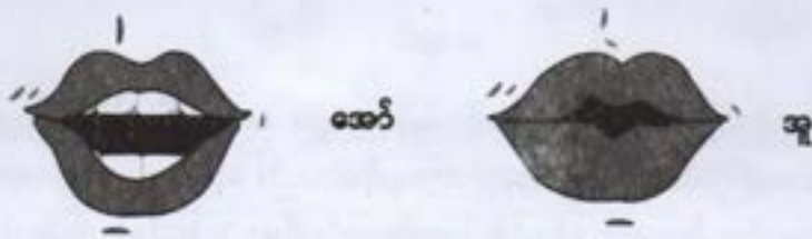
နှုတ်ခမ်းဝိုင်းသရများ

အချို့သရများကို ရွတ်ဆိုသည့်အခါ လေသည် နှာခေါင်းမှထွက်သွားကာ နှာခေါင်းသံပါသွားသဖြင့် ယင်း သရတို့ကို 'နှာသံပါသရ'ဟု ခေါ်ပါသည်။ 'နှာသံပါသရ' ခုနစ်သံ ရှိသည်။ ယင်းတို့မှာ 'အင်၊ အန်၊ အွန်၊ အိန်၊ အုန်၊ အိုင်း၊ အောင်'တို့ ဖြစ်ပါသည်။